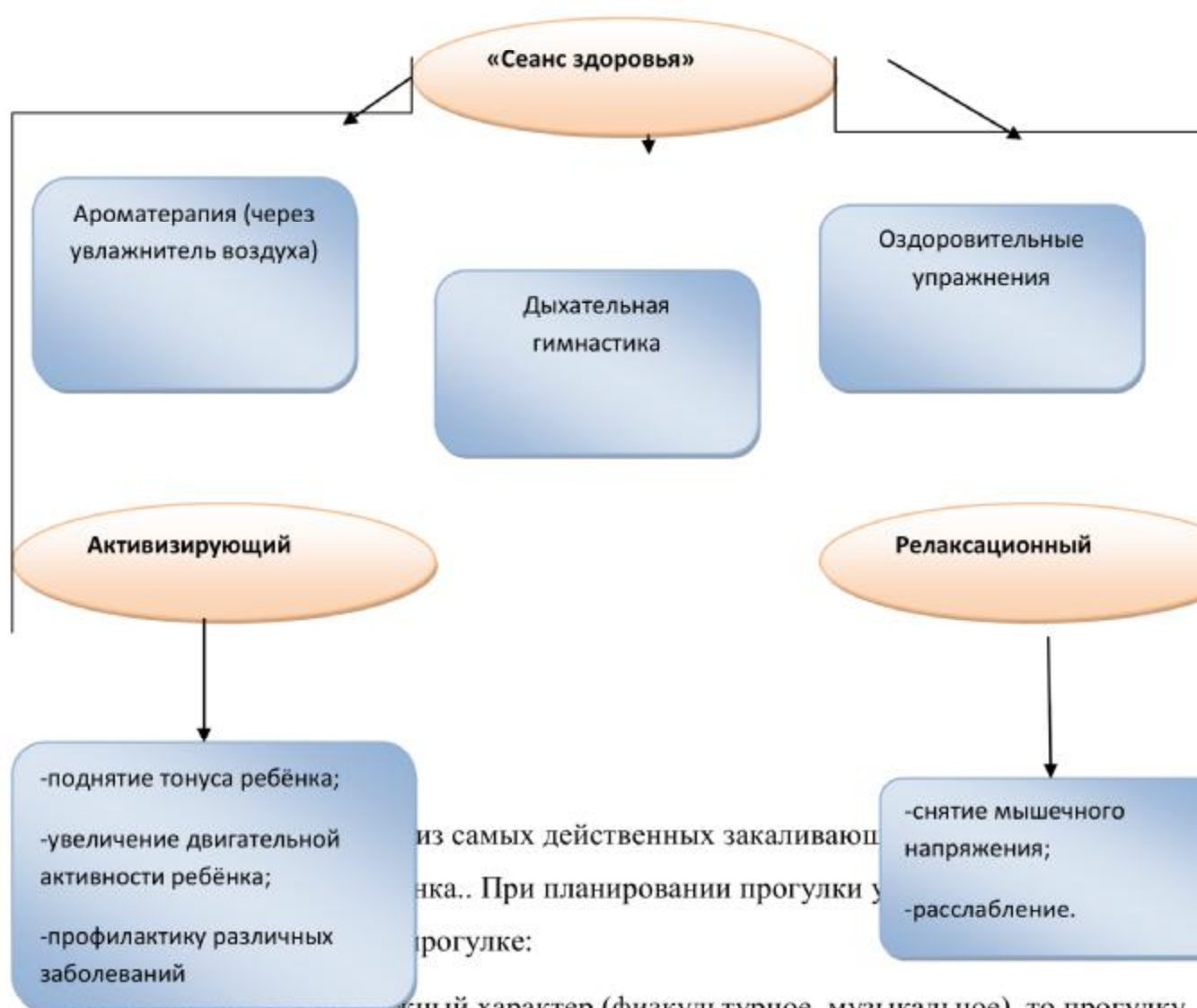
Схема «Сеанса здоровья» МБОУ СОШ №10 г.Грязи

- если они носят подвижный характер (физкультурное, музыкальное), то прогулку лучше начать с наблюдения,